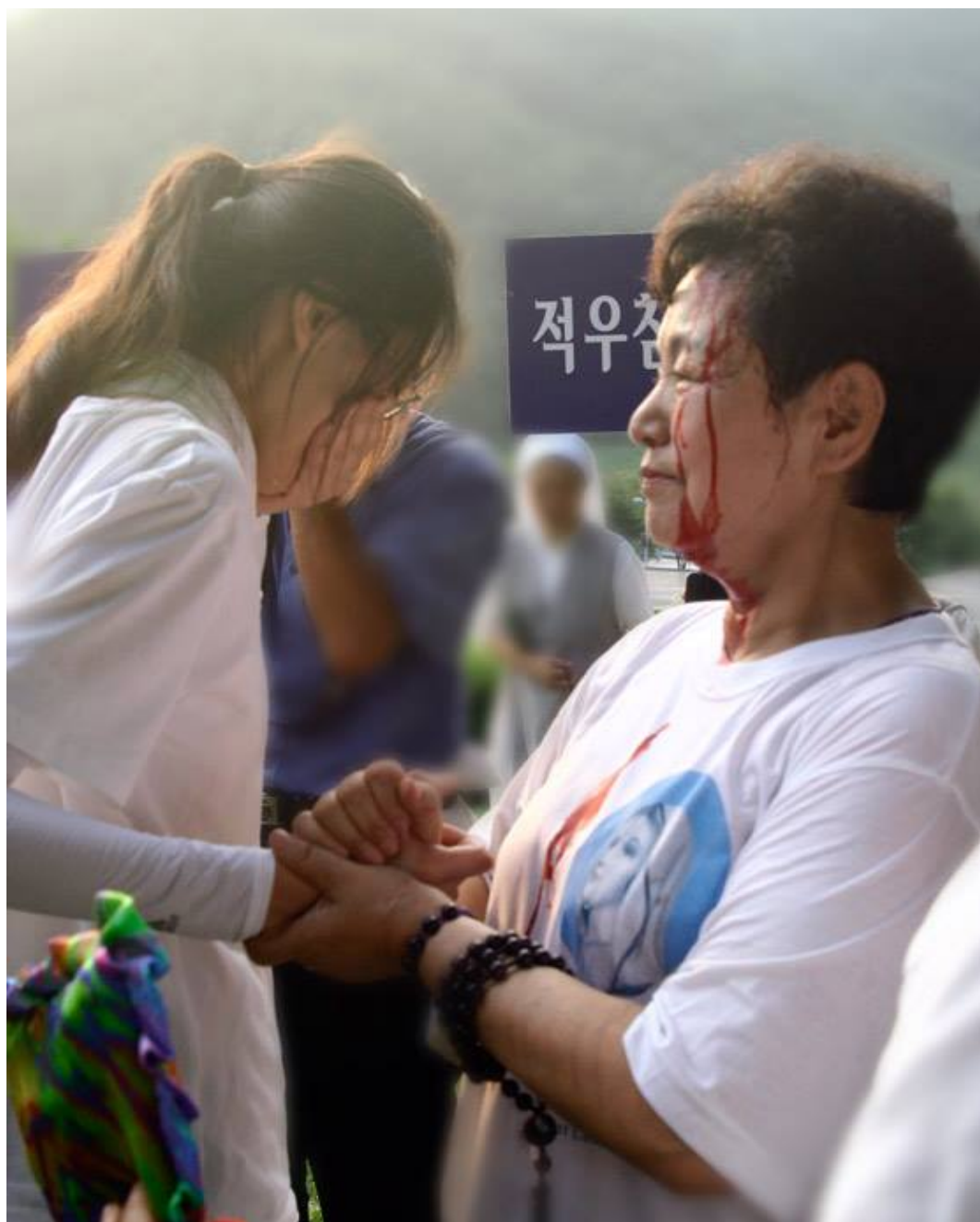
Mama Julia aime plus ses voisins qu'elle-même.